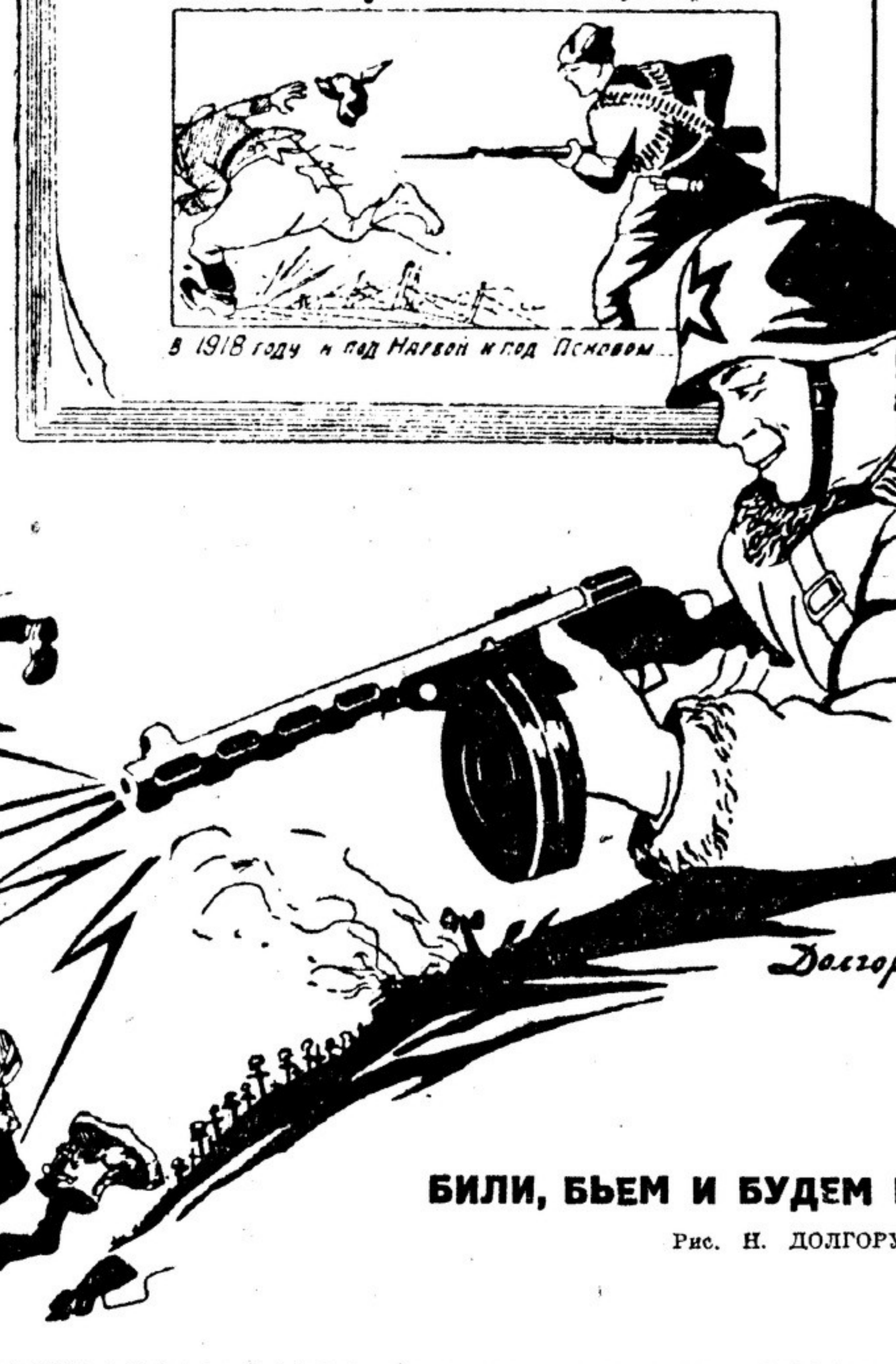
Били, бьем и будем биты